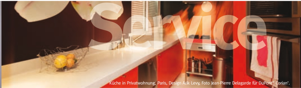
Küche in Privatwohnung, Paris, Design Arik Levy, Foto Jean-Pierre Delagarde für DuPont® Corian®.