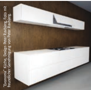
„Eurosims“ Küche, Design Peter Behring

Mit dem Namen DuPont können sie Qualität, Zuverlässigkeit und Kundenorientierung verbinden. Dies endet nicht mit dem Verkauf der Ware. DuPont verfügt über ein ausgedehntes Netzwerk gut ausgebildeter und erfahrener Verarbeiter. Damit stellen wir sicher, dass die Installationen in ausgezeichnetem Zustand den Endkunden erreichen und ihre Funktion zu vollster Zufriedenheit erfüllen werden. Dies gilt für kommerzielle und private Anwendungen gleichermaßen.